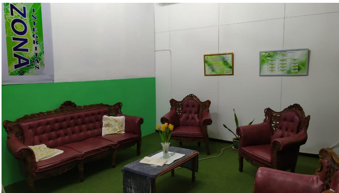
Ruang Pelayanan PPID Biro ADPEM Setda Prov. Kalbar