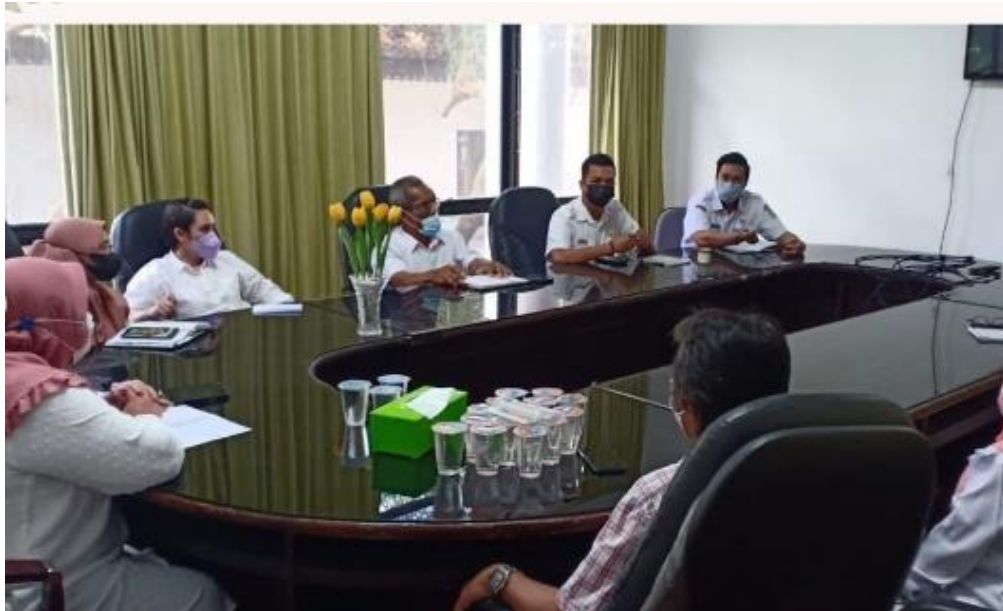
Rapat Pemberian Arahan Biro Administrasi Pembangunan