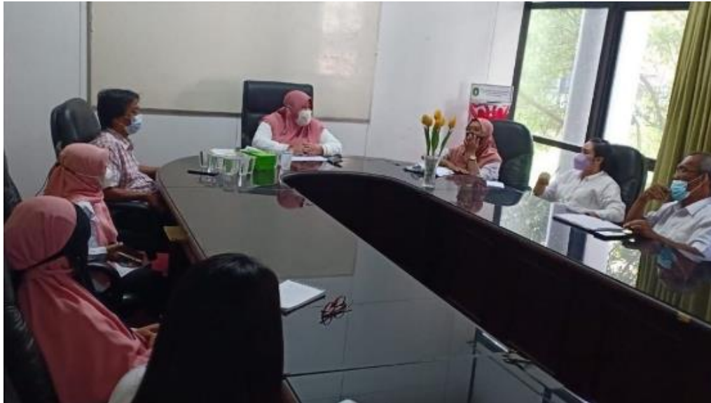
Rapat Koordinasi Anggota PPID Pembantu Biro Administrasi Pembangunan