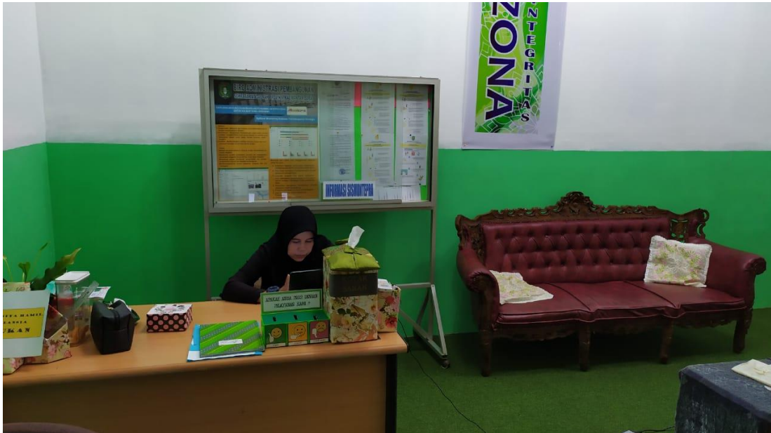
Front Office Biro Administrasi Pembangunan