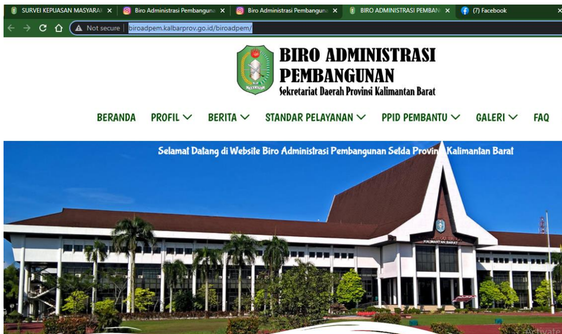
Gambar 4 Website Biro Administrasi Pembangunan

Terdapat beberapa pelayanan yang tersedia pada layanan Front Office Biro Administrasi Pembangunan Setda Prov. Kalbar, seperti Informasi Pembangunan Strategis Prov. Kalbar. Selain memberikan informasi berdasarkan permintaan dari pemohon, Tim PPID Biro Administrasi Pembangunan juga aktif memberikan informasi publik melalui Website Biro Administrasi Pembangunan yang dapat diakses pada alamat http://biroadpem.kalbarprov.go.id/biroadpem/ sebagai sarana utama Tim PPID Biro Administrasi Pembangunan dalam memberikan informasi publik.